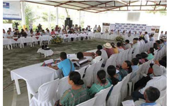
Reunión de la Mesa Intersectorial del Sur de Petén, San Luis, Petén, Guatemala, Marzo 2014.

Promover Alternativas Económicas: Apoyar a las comunidades en la RBM y la Zona de Adyacencia con Belice con producción de miel y “fondos semillas” para iniciativas productivas.